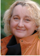
Theresia Bauer MdL, Ministerin für Wissenschaft, Forschung und Kunst Baden-Württemberg